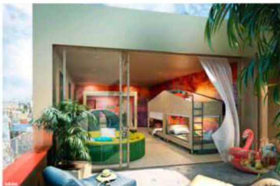
Le relais de Raqueferre