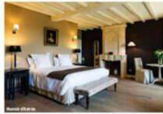
Le relais de Raqueferre