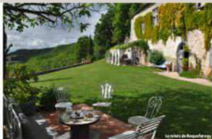
Le relais de Raqueferre

Rue de la Cavalerie, Bordeaux. N° : 05 57 20 44 44 Bordeaux.intercontinental.com En plein centre-ville, dernière œuvre d'un architecte célèbre, récemment rénové par Jacques Garcia, qui se reflète dans les 150 chambres aux atmosphères variées et raffinées. La restauration est signée du chef étoilé Gordon Ramsay et le spa est grillé à la mode : deux autres références du luxe. Chambre double à partir de 200 €, petit-déjeuner compris.