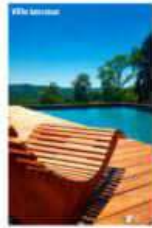
Le relais de Raqueferre

24, rue Péneloup, Odiot, Limoges. N° : 06 67 03 12 24 www.dupainetdubeurre.fr Une étape très agréable, en plein centre-ville pour se poser et profiter d'étonnantes chambres thématiques (Carte Marine, Chapeau, Jim Morrison, Van Gogh), du boulevard ou de la terrasse. Chambre double à partir de 54 €, petit-déjeuner compris.